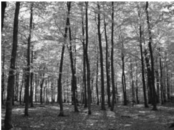
Regional släkträff planeras 11 maj 2003 till den skånska bokskogen