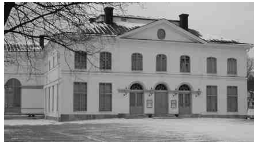
Regional släktträff planeras till 14 juni 2003 på Drottningholm